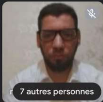
7 autres personnes